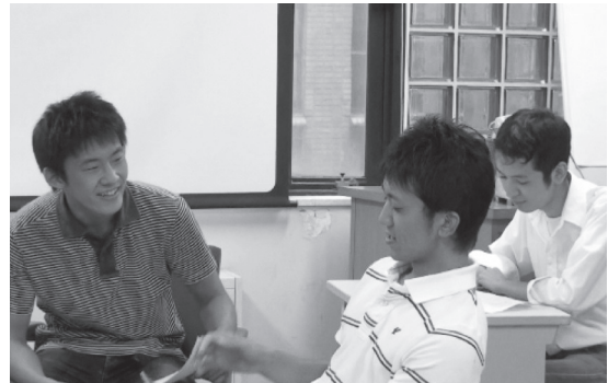
写真7. WS2 Cチームの寸劇の様子（左は1995年、右は2009年）