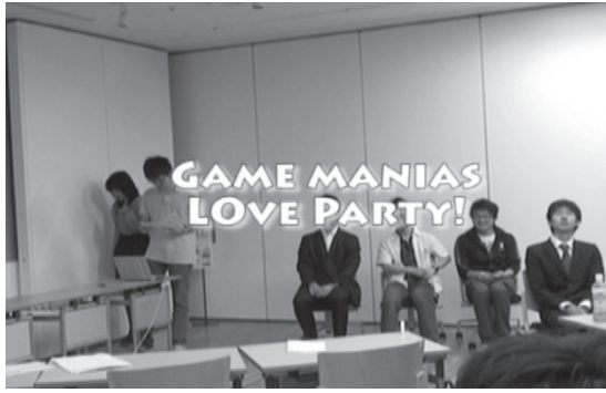
写真1. WS1 ソウル・チームの寸劇の様子