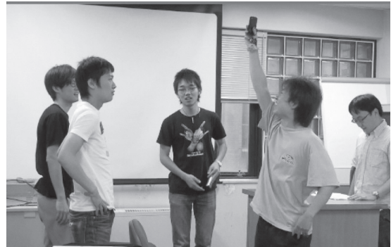
写真6. WS2 Bチームの寸劇の様子（左は1995年、右は2009年）