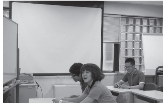
写真5. WS2 Aチームの寸劇の様子（左は1995年、右は2009年）