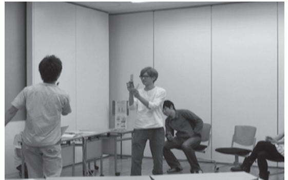
写真3. WS1 上海チームの寸劇の様子