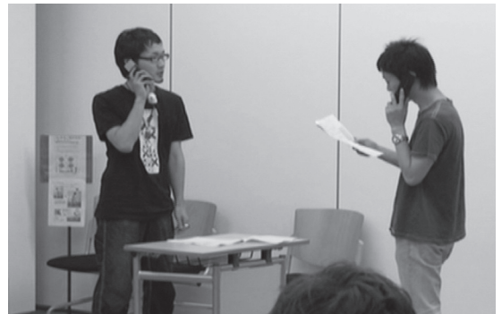
写真4. WS1 パルセロナ・チームの寸劇の様子