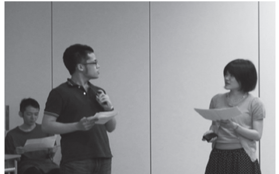
写真2. WS1 メルボルン・チームの寸劇の様子