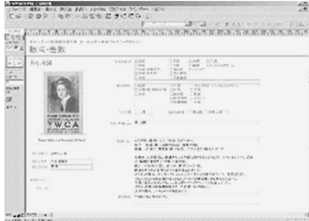
図2. 版式調査 データ入力画面

調査では、該当する分類項目のチェックだけでなく調査者たちのコメントも可能な限り拾い、データとして入力を行っている。調査結果を導き出すための根拠が示されると同時に、どの部分について何が議論されたかといったことや、そのポスターの特徴を知る手掛かりともなる。調査のプロセスそのものも情報として蓄積していることが、本調査の特色のひとつである。