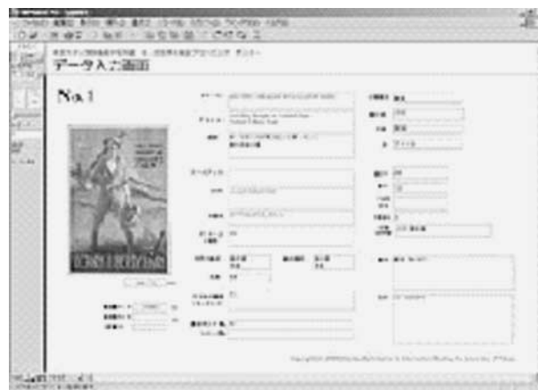
図1. 基礎データ入力画面

A)、B) の資料については、その性格の違いから、まず民間の撮影業者に資料の撮影とデジタル化を依頼して画像データを作成した上で、それぞれ独立したデジタル・アーカイブを作成している。